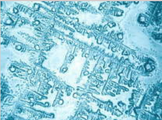
Stadtwasser ohne Behandlung